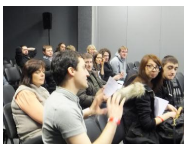
クロッカス エキスポでの上映会およびプレゼンテーション (平成 24 年 2 月 25 日、26 日開催)