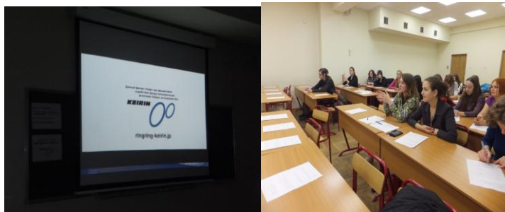
モスクワ市立教育大学での上映会およびプレゼンテーション (平成 24 年 2 月 24 日開催)